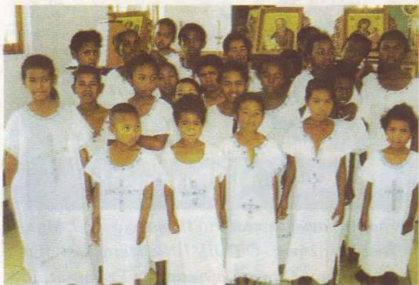
Ὁμαδικές βαπτίσεις στή Μαδαγασκάρη.