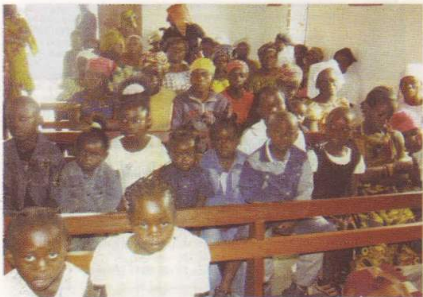
Τά αφρικανόπουλα προσμένουν πολλά από την Ὁρθόδοξο Ἐκκλησία